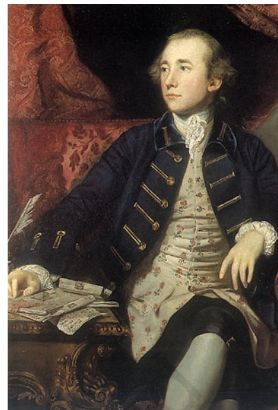
चित्र 3 - वॉरेन हेस्टिंग्स 1773 में पहले गवर्नर-जनरल बने।

मिल को लगता था कि सारे एशियाई समाज सभ्यता के मामले में यूरोप से पीछे हैं। इतिहास की उनकी समझदारी ये थी कि भारत में अंग्रेजों के आने से पहले यहाँ हिंदू और मुसलमान तानाशाहों का ही राज चलता था। यहाँ चारों ओर केवल धार्मिक बैर, जातिगत बंधनों और अंधविश्वासों का ही बोलबाला था।