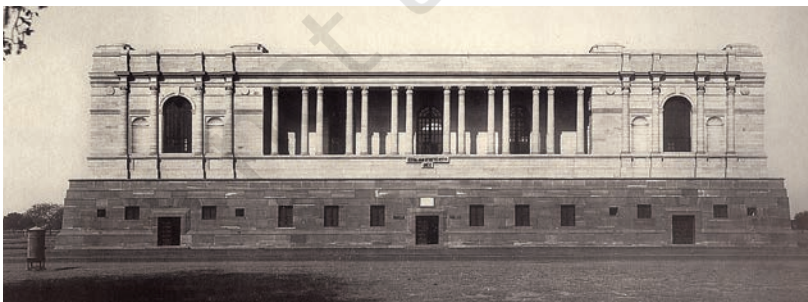
चित्र 4 - भारतीय राष्ट्रीय अभिलेखागार 1920 के दशक में बनाया गया।

उन्नीसवीं सदी की शुरुआत में प्रशासन की एक शाखा से दूसरी शाखा के पास भेजे गए पत्रों और ज्ञापनों को आप आज भी अभिलेखागारों में देख सकते हैं। वहाँ आप ज़िला अधिकारियों द्वारा तैयार किए गए नोट्स और रिपोर्ट पढ़ सकते हैं या ऊपर बैठे अफ़सरों द्वारा प्रांतीय अधिकारियों को भेजे गए निर्देश और सुझाव देख सकते हैं। उन्नीसवीं सदी के शुरुआती सालों में इन दस्तावेजों की सावधानीपूर्वक नकलें बनाई जाती थीं।