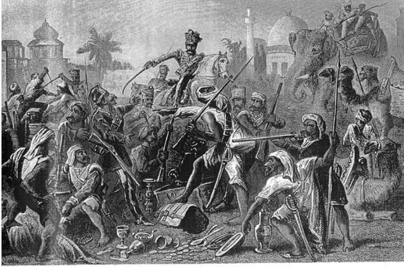
चित्र 7 - 1857 के विद्रोही।

तसवीरों को भी बहुत ध्यान से देखना चाहिए। उनसे हमें चित्रकार की सोच पता चलती है। 1857 के विद्रोह के बाद अंग्रेजों द्वारा तैयार की गई सचित्र पुस्तकों में यह तसवीर कई जगह दिखाई देती है। इस तसवीर के नीचे लिखा होता था — “बागी सिपाही लूट-खसोट में लगे हुए हैं”। अंग्रेजों की नज़र में विद्रोही जनता लालची, दुष्ट और बेरहम थी। इस विद्रोह के बारे में आप अध्याय 5 में पढ़ेंगे।