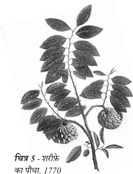
चित्र 5 - शरीफे का पौधा, 1770 का दशक।

अंग्रेजों द्वारा बनाए गए वानस्पतिक उद्यान और प्राकृतिक इतिहास के संग्रहालयों में विभिन्न पौधों के नमूने और उनसे संबंधित जानकारीयें इकट्ठा की जाती थीं। इन नमूनों के चित्र स्थानीय कलाकारों से बनवाए जाते थे। अब इतिहासकार इस बात पर ध्यान दे रहे हैं कि इस तरह की जानकारी किस तरह इकट्ठा की जाती थी और इससे उपनिवेशवाद के बारे में क्या पता चलता है।